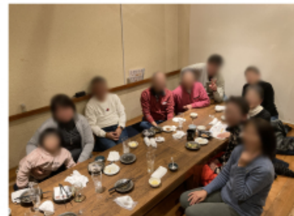
陣原支部と折尾支部のみなさん