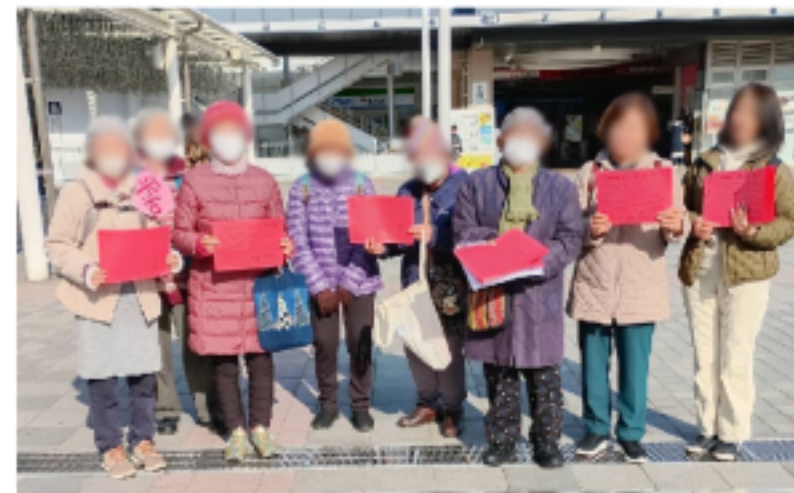
赤紙配りに参加した各団体のみなさん