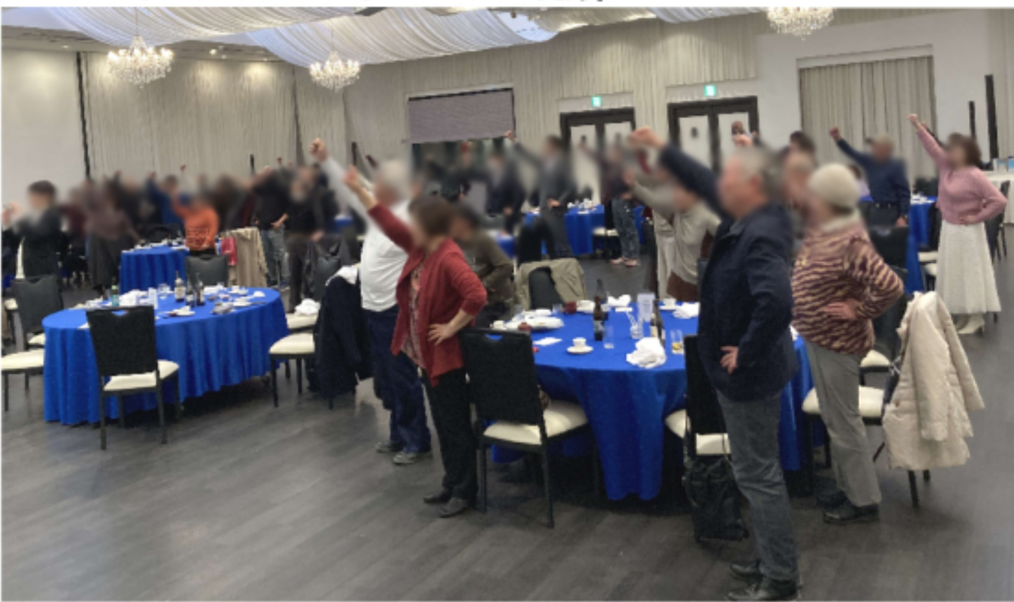
今年も一年 みんなで「団結ガンパロー！」