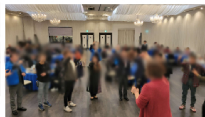
豪華景品の為に みんなでじゃんけんポン!