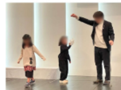
子供たちもゲームに参加