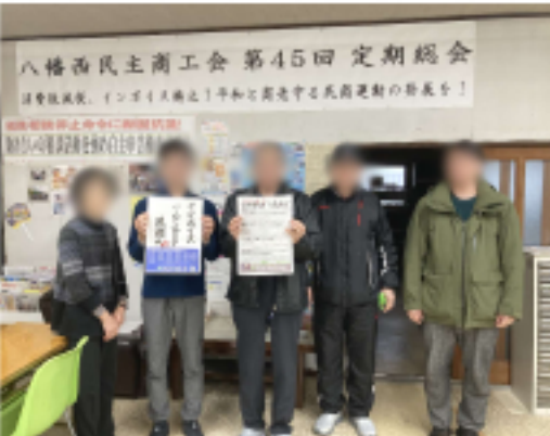
ビラ宣伝を行った役員と事務局

お知らせ 《記帳相談会》 2月17日(月) 13:30~ 18日(火) 13:30~ 《無料法律相談》 3月12日(水) 18:30~ ※事前に予約必要 民商事務所 ☎ 641-2417