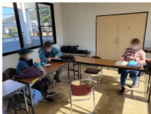
黒畑市民センター 班会の様子