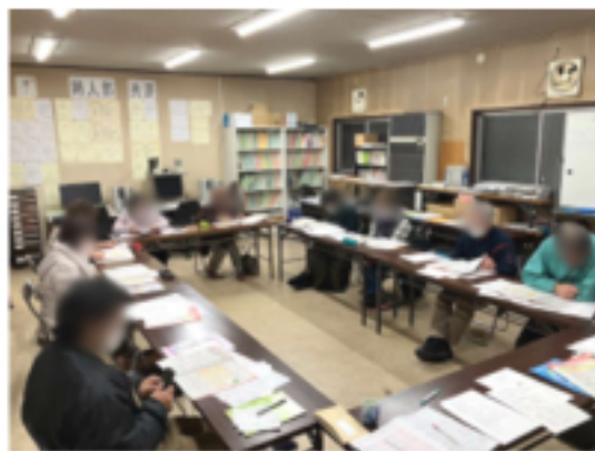
相談員学習会の様子

今年も、確定申告の時期となりました。民商では「自主計算・自主申告」を推進し、分らないところは、班に集まり相談し合う活動を行っています。 相談活動を行うにあたり、2月14日、八幡西民商で税金相談員学習会を開催し、11人が参加しました。