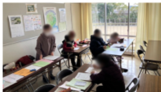
八児市民センター 班会の様子