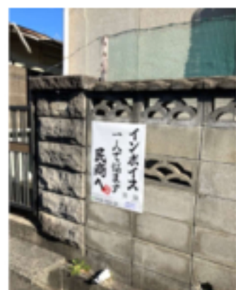
会員宅前の宣伝チラシ

スを切り捨てる税務署や重税への怒りの声が上がりました。 【会員・読者へ紹介ください!】確定申告が始まり、頭を抱えている商売人も多いと思います。インボイス・定額減税などお困りの方へ民商を「紹介ください」。よろしくお願いいたします。