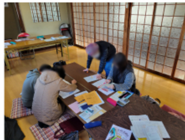
紅梅公民館 班会の様子