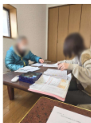
折尾支部の班会の様子

折尾駅周辺では、折尾土地区画整理事業計画で長年商売をしたお店がずらりと取り壊しになり、とうとう会員さんのお店も昨年の3月末で立ち退きとなり、5月に移転しました。常連さんも多かったのですが、苦渋の決断でしたが、今では商売も軌道に乗りにつつあるそうです。また、他の会員さんは、「商店街の大家さんが亡くなって、商店街を取り壊すから、お店を4月に閉める事になったんよ。」「うちの店は北九州市から後世に残したい店に指定されているから移転先を北九州市が見つけてくれると言ったけど、もう年だから廃