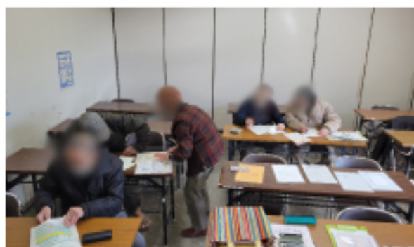
穴生市民センター 班会の様子