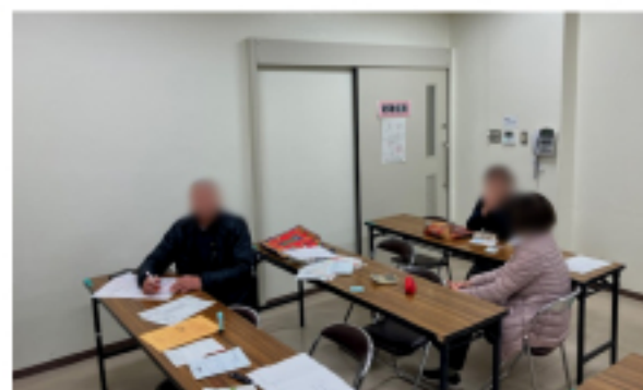
八児市民センター 班会の様子