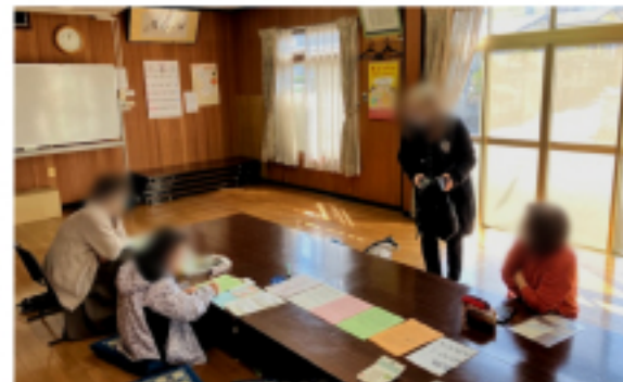
ひまわり会館 班会の様子