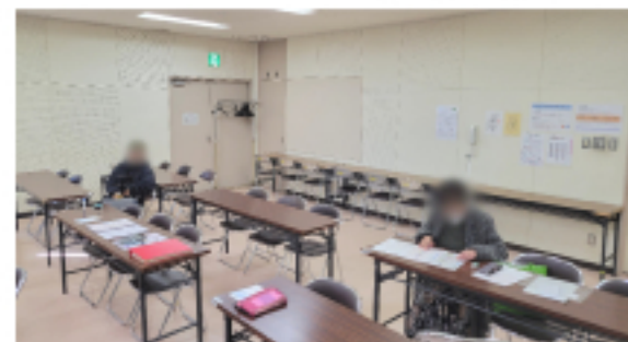
黒崎市民センター 班会の様子