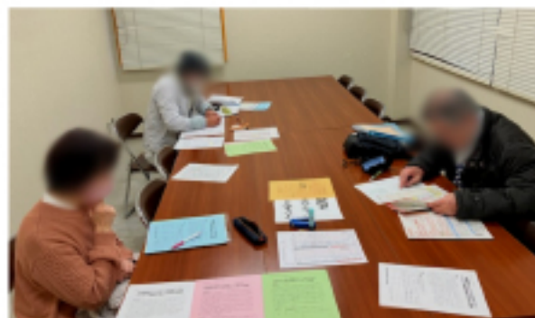
中尾市民センター 班会の様子