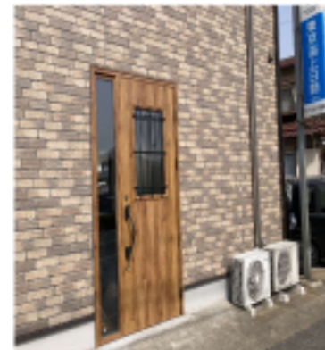
リフォームした入口

広場に咲くチロリアンデージー。花言葉は、「無邪気」「純潔」「希望」です。「day's eye」と言う言葉がデージーの名前の由来です。この言葉は、日光がさすと花を開き、黄色い花芯を見せて、夜や曇っている日には花が閉じる性質からきています。