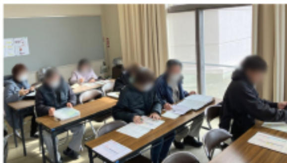
香月市民センター 班会の様子