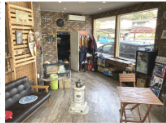
作業待ちの事務所であつらげます

家電などなんでも壊れたら、すぐに分解します。直すのが好きで、元に戻った時は、嬉しいというか達成感というかその感覚が何とも言えず、その経験が今の仕事に繋がっていると自覚します。高校は、自動車科を卒業し、知り合いの整備工場に就職。5年程務めたところ、父親が身体を壊したのをきっかけに、家業を継いだそうです。