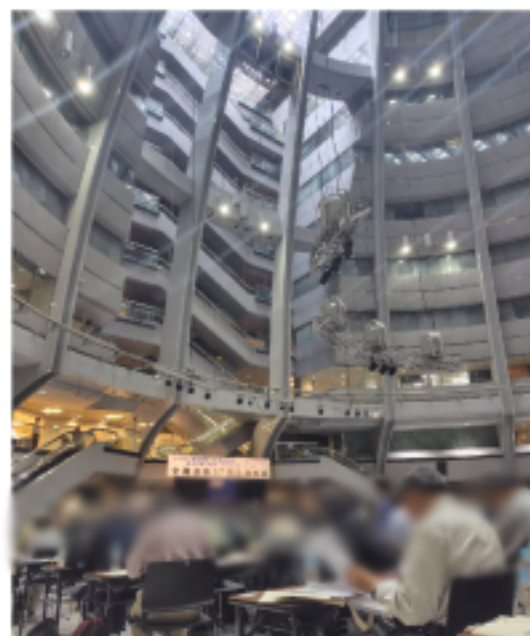
広く、きれいで壮麗な全体会会場